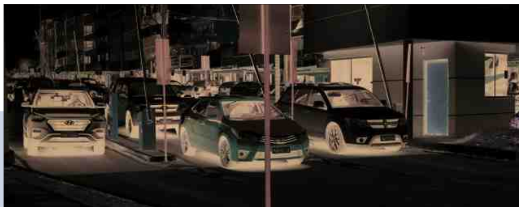
Na terça-feira, dia 19.11.2019, 5.070 veículos entraram pelas cancelas 1, 2 e 3. Sendo que 1.310 veículos foram identificados na cancela 1 como visitantes.

Neste informativo abordamos alguns itens que juntos podemos melhorar!