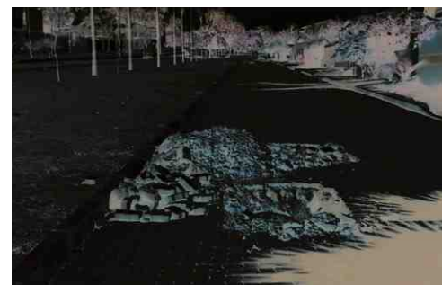
Localização e levantamento de PVs

Para o avanço do estudo de adequação da nossa Rede de Águas Pluviais foi necessário localizar mais de 100 PVs (Postos de Visita) que não tinham sido levantados ao nível da rua quando da obra de águas pluviais. Esse difícil trabalho de localização e levantamento ao nível da rua é necessário, pois permitirá a avaliação da dimensão dos tubos e capacidade de escoamento das águas de chuva. Já em fase de conclusão, o trabalho provocou um atraso inevitável no cronograma do projeto. Mas, o trabalho de recadastramento e avaliação da rede já foi retomado e nas