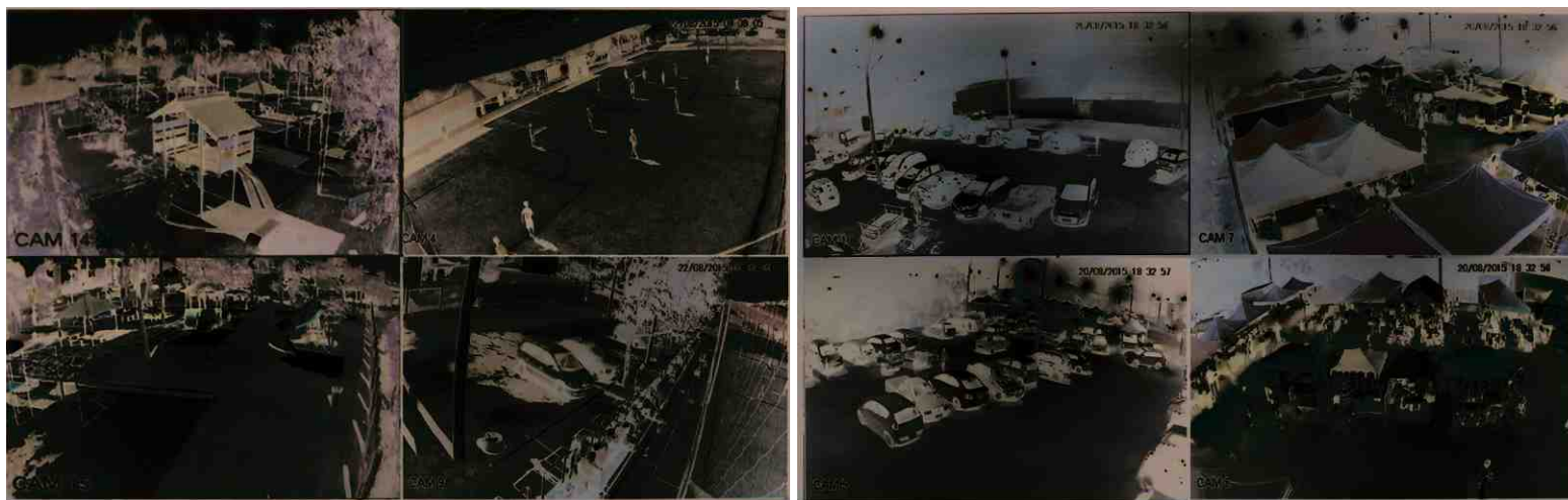
A área do parquinho, do campo de futebol, do CCE e da feira está monitorada por câmeras. Maior segurança para todos

Diante do crescente caos que se tornou a segurança pública, precisamos cuidar cada vez mais da segurança das nossas famílias. Por isso, a segurança é uma das prioridades desta gestão.